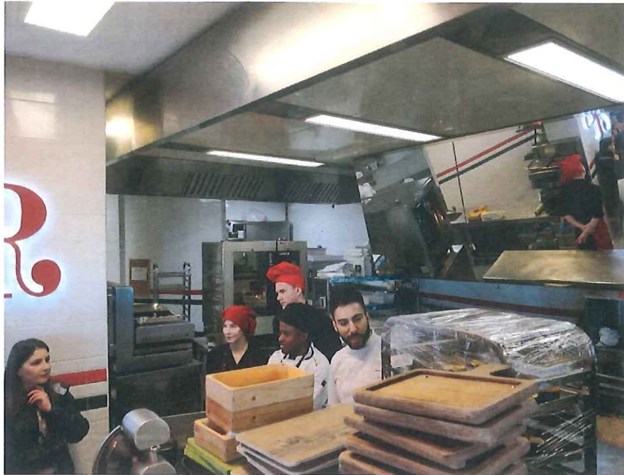
3. ábra Látogatás az Acino Srl. vállalkozásnál – Ristorante Amorimini in Rimini