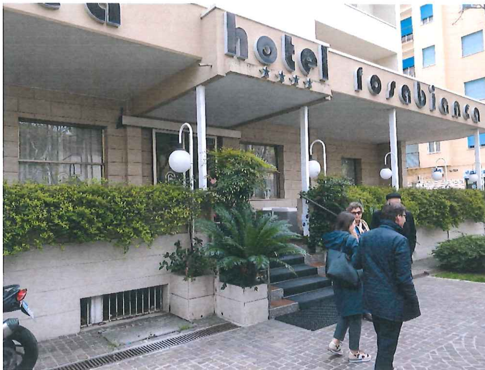
6. ábra Szakmai látogatás az M.L. S.r.l. vállalkozásnál, Hotel Rosabianca szálloda és étterem

Riminiben az év meghatározott időszakára jellemző magasabb munkanélküliséget nem csupán a néhány ágazatban jelentősen lecsökkenő munkahelyek száma okozza. A szezonális ágazatokban, különösen a domináns turizmus, vendéglátásban, és főként a turisztikai szakmák esetében jellemző ok, hogy a szezon a korábbi 6 hónapról 2-3 hónapra csökkent, mellyel a szükséges munkaerő-kereslet arányosan és főleg időszakosan jelentősen visszaesik. Hasonló tendencia