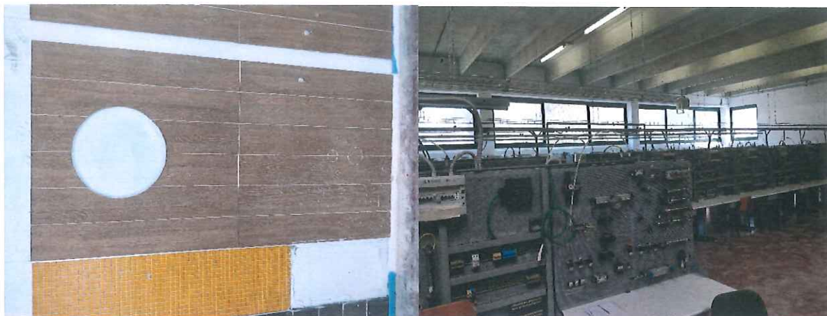
1. ábra Szakmai látogatás az Ente C.P.T iskolában

Szintén pozitív gyakorlatnak vélem, hogy a szakképzések rendkívül gyakorlatorientáltak. A megtekintett gyakorlati helyek mind, mind a tanulók szakmai gyakorlati képességeinek és készségeinek fejlesztését helyezték előtérbe, szisztematikusan fejlesztik a gyakorlati ismereteket.