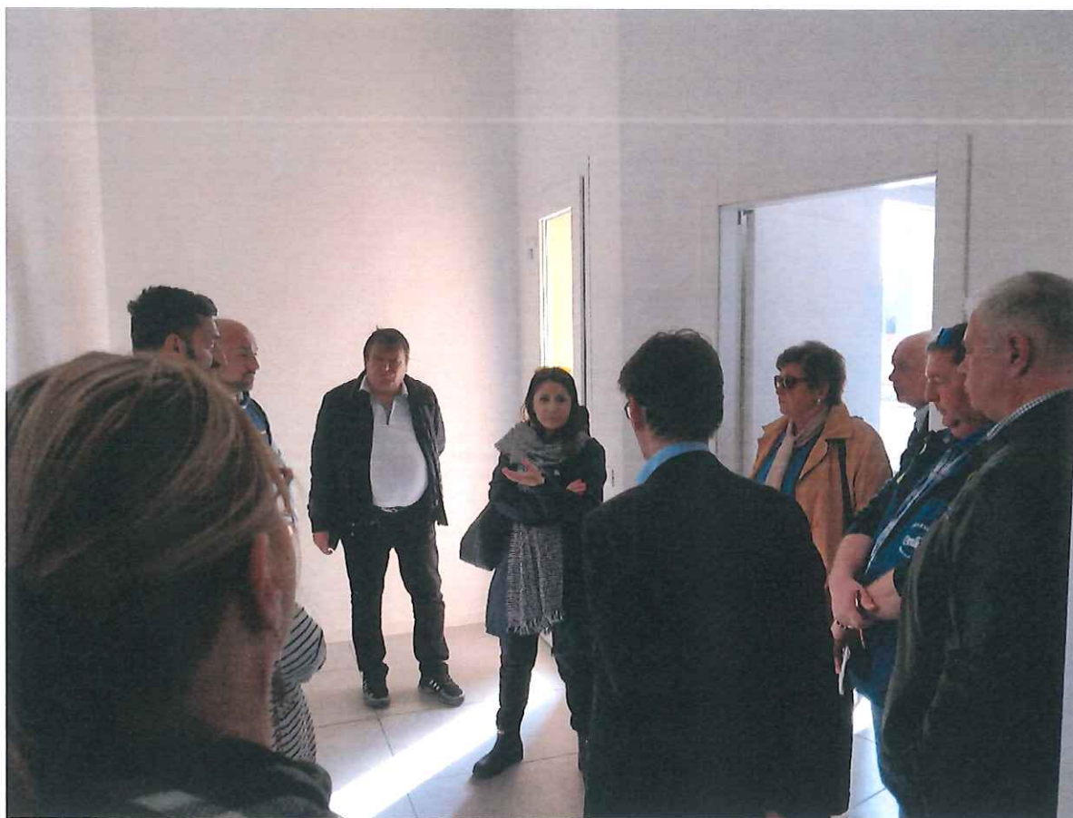
2. ábra Látogatás a NUOVA RAMA 3 DEI F.LLI CECCHI MATTIA E MIRKO S.N.C. vállalkozásánál

Szintén támogatandónak és a hazai viszonyok között is alkalmazandónak vélem az hallgatói érdekeltségi rendszer megteremtése érdekében a diákok részbeni költségterítésének alkalmazását. Hozzáteszem, hogy a diákok a szakmai gyakorlat időtartama alatt dolgoznak, melyért munkabért kapnak, így ebből akár önállóan is képesek a képzési részhozzájárulás megfizetésére. De feltétlenül támogatandónak vélem a hallgatói önköltség vállalásának kötelezését, mely vélhetően csökkentheti a képzésből való lemorzsolódást, továbbá motiválólag hat a képzések sikeres befejezésére.