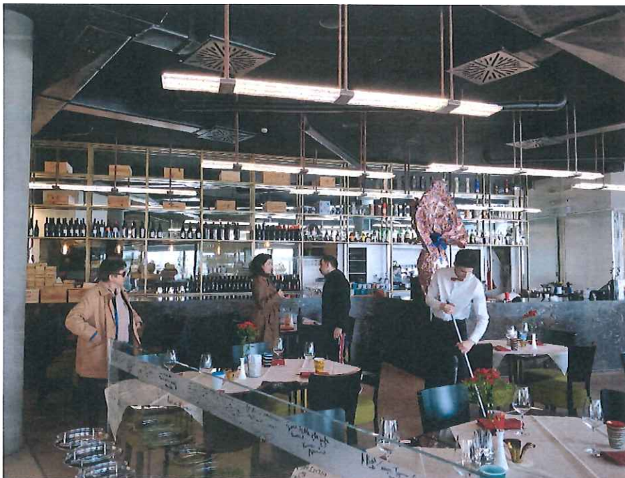
4. ábra Látogatás az Acino Srl. vállalkozásnál – Ristorante Amorimini in Rimini

Valamennyi megtekintett gyakorlati képzőhelyen magasnak véltem a munkaadói elkötelezettséget és az érdekeltséget a szakképzésben részt vevők gyakorlati oktatásában való közreműködésre. Meglátásom szerint e nélkül az elkötelezettség nélkül nehéz jó szakképzési rendszert működtetni, bár bizonyára anyagiakban is megéri számukra, továbbá véleményem szerint a szükséges munkaerő biztosításában és pótlásában nagyban támaszkodnak ezek a vállalkozások az általuk képzett és náluk végzett diákokra.