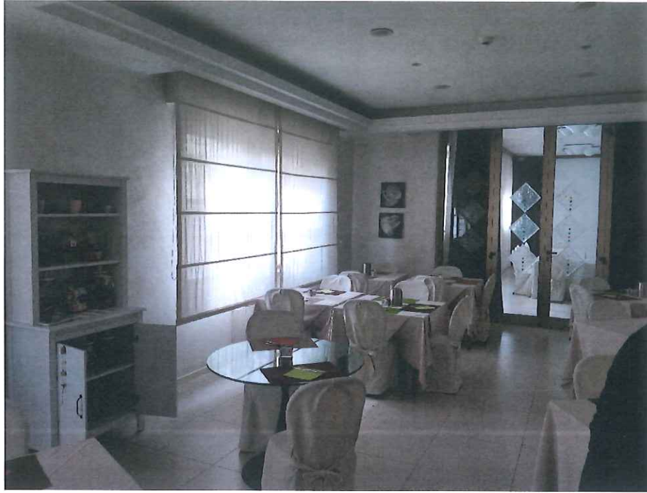
5. ábra Szakmai látogatás az M.L. S.r.l. vállalkozásnál, Hotel Rosabianca szálloda és étterem