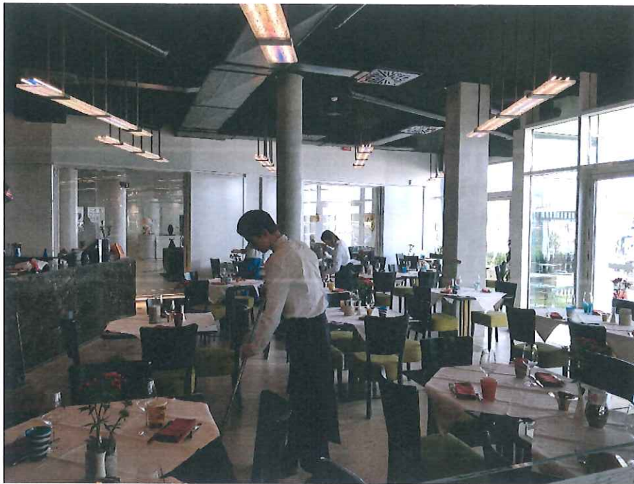
7. ábra Látogatás az Acino Srl. vállalkozásnál – Ristorante Amorimini in Rimini

figyelhető meg az építőipari szakmák esetében is. Ezzel párhuzamosan léteznek tartós hiányszakmák, ahol alkalmatlanság miatt, vagy jelentkezők hiánya miatt nincs elegendő munkavállaló. Ez utóbbi jelenség főleg a szociális és a műszaki szférában figyelhető meg. Riminiben a probléma megoldására olyan ösztönző rendszert vezettek be a gazdálkodók számára, amellyel arra motiválják őket, hogy az iskolát elvégzett fiatalokat nagyobb számban alkalmazzák. Lényege, hogy a programban résztvevő fiatalok munkabérét az állami költségvetésből finanszírozzák. A gazdálkodó fizet ugyan munkabért, azonban ezt a költséget az adójából levonhatja. Ezzel a szubvencionált rendszerrel a fiatal munkagyakorlatot szerez, ugyanakkor foglalkoztatásának és gyakorlatlanságának költségei nem a munkaadót terhelik.